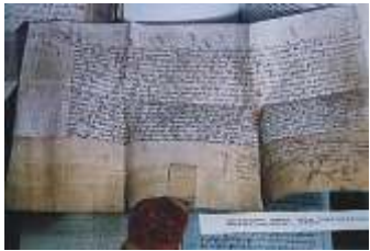
Originalurkunde und Siegel

Wy Karle vander gnaden goitz Hertouge van Gelre ind Greve van Zutphen doen kont ind bekennen, dat wy om Neronge wailfaeren ind gueder toeneigonge, wy draegen tot onsen lieven scepen, geswaeren ind ondersaeten onss kirspeles van Lobboicke in onsen laende van Creekenbeeck gelegen denselven onsen kerspell gade en der heiliger kercken to eeren en to dienst tot repareren s dorps en maekinge der steenstraeten gnedlich vergont en gegeven hebben vergonnen en geven mitz dezen onsen brieff voir ons, onse erven en naekommelingen twee vrye jairmarckten then ewigen daigen toe geduende.